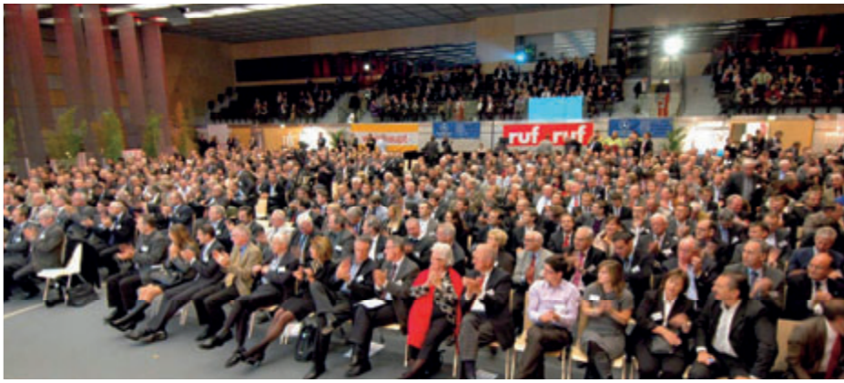
Voller Saal in der Stadthalle Dietikon.