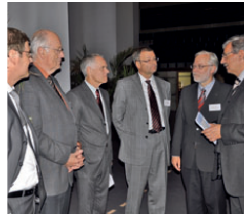
Briefing durch den Moderator.