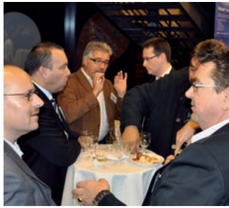
Pflege des Netzwerkes!