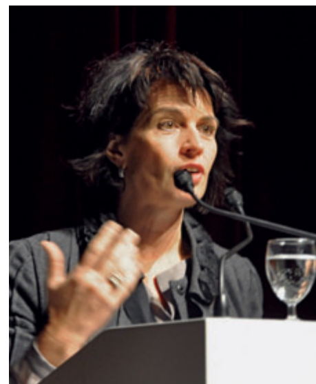
Bundesrätin Doris Leuthard 2009