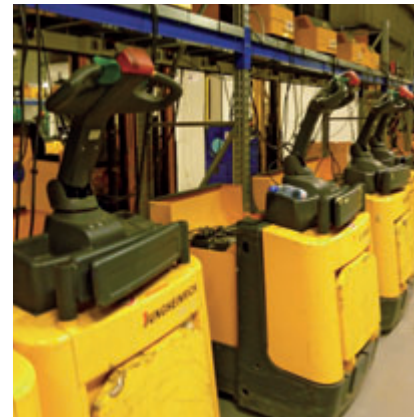
Moderne Hilfsmittel bei COOP.