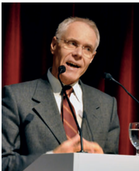
Bundesrat Mortitz Leuenberger 2008